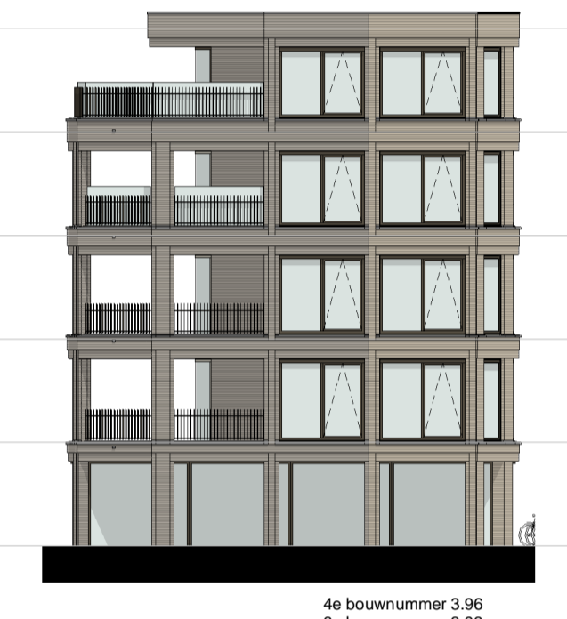
gevel 3.6 1 : 200

▽ +15400 05 vijfde verdieping ▽ +12320 04 vierde verdieping ▽ +9240 03 derde verdieping ▽ +6160 02 tweede verdieping ▽ +3080 01 eerste verdieping ▽ Peil=0 00 begane grond