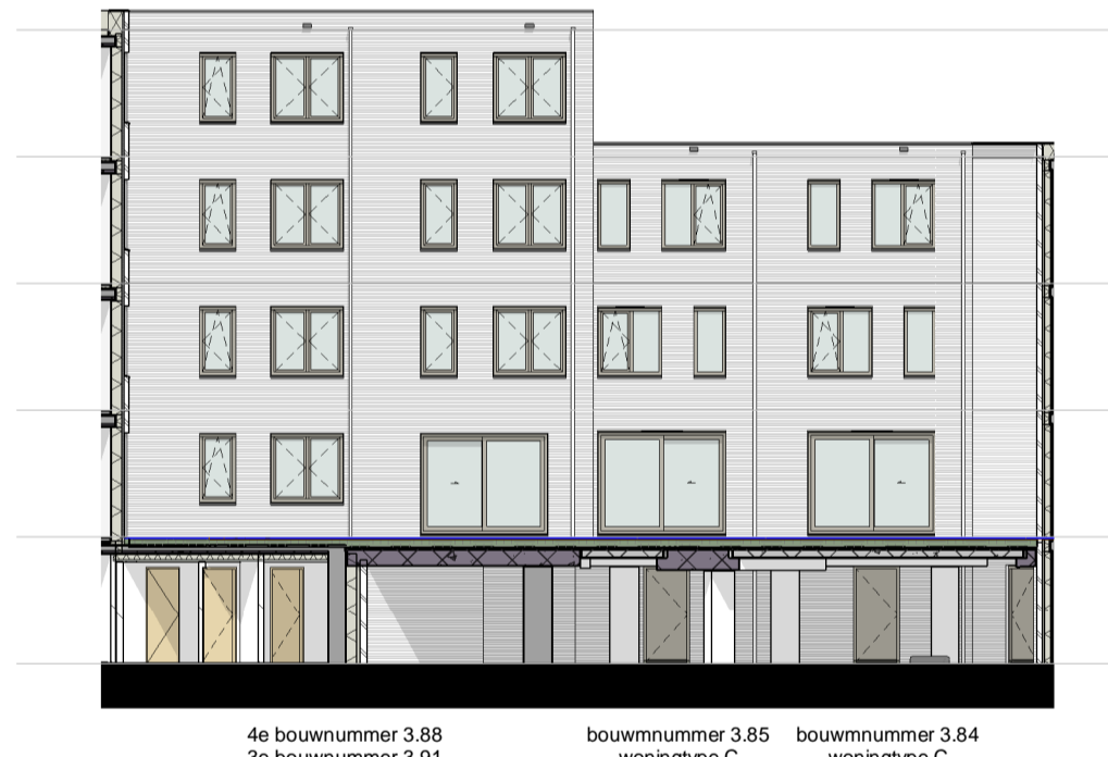
gevel 3.11 1 : 200

▽ +12320 04 vierde verdieping ▽ +9240 03 derde verdieping ▽ +6160 02 tweede verdieping ▽ +3080 01 eerste verdieping ▽ Peil=0 00 begane grond