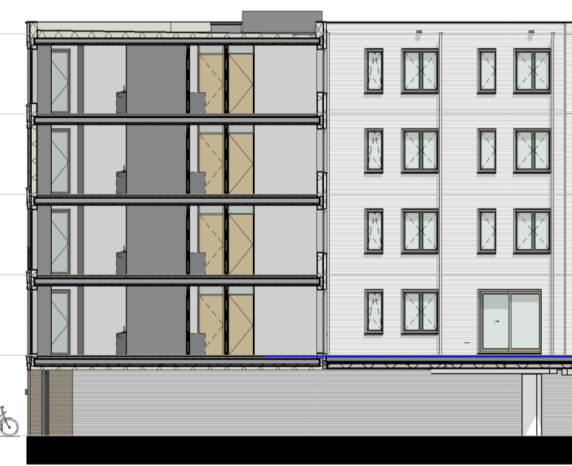
gevel 3.10 1 : 200

▽ +15400 05 vijfde verdieping ▽ +12320 04 vierde verdieping ▽ +9240 03 derde verdieping ▽ +6160 02 tweede verdieping ▽ +3080 01 eerste verdieping ▽ Peil=0 00 begane grond