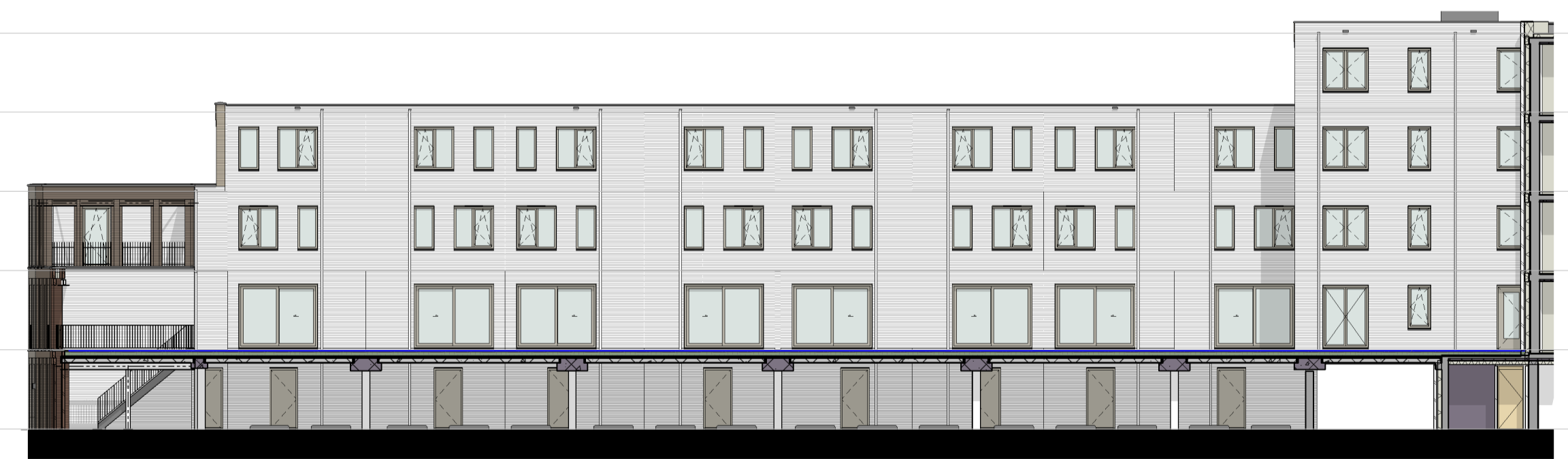
gevel 3.9 1 : 200

▽ +15400 05 vijfde verdieping ▽ +12320 04 vierde verdieping ▽ +9240 03 derde verdieping ▽ +6160 02 tweede verdieping ▽ +3080 01 eerste verdieping ▽ Peil=0 00 begane grond