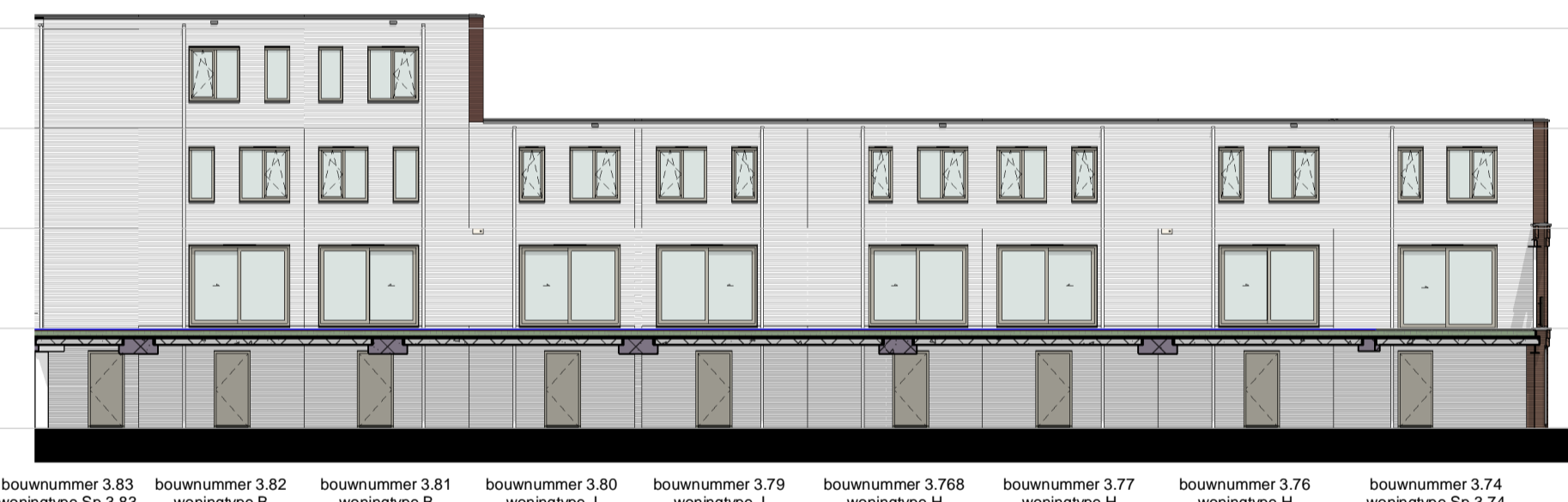
gevel 3.7 1 : 200

▽ +15400 05 vijfde verdieping ▽ +12320 04 vierde verdieping ▽ +9240 03 derde verdieping ▽ +6160 02 tweede verdieping ▽ +3080 01 eerste verdieping ▽ Peil=0 00 begane grond