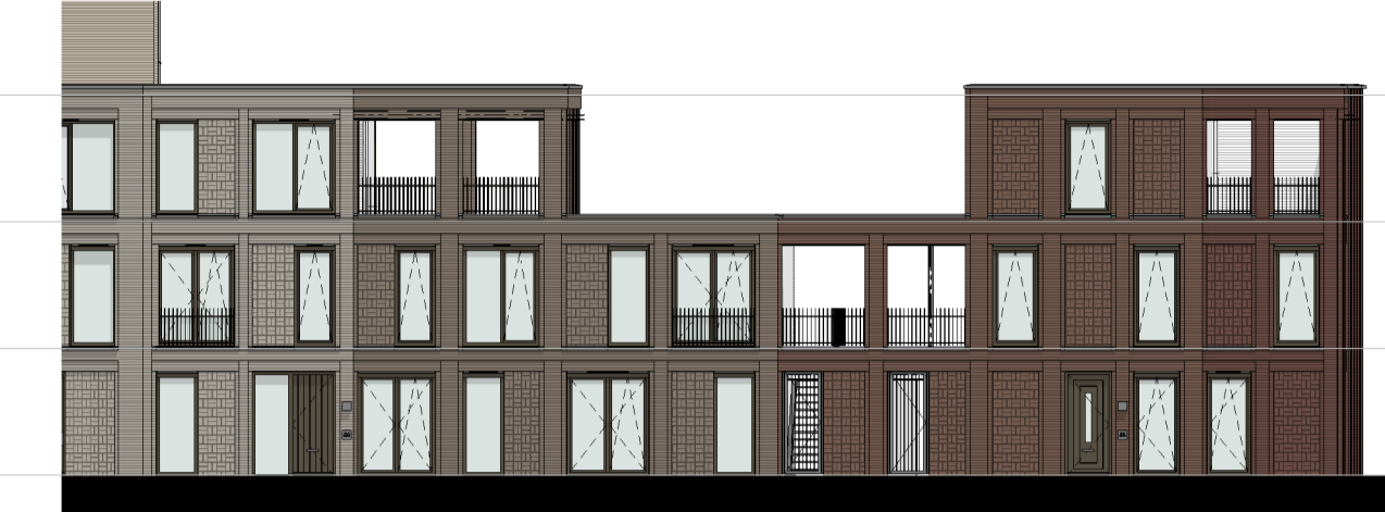
gevel 3.3 1 : 200

▽ +9240 03 derde verdieping ▽ +6160 02 tweede verdieping ▽ +3080 01 eerste verdieping ▽ Peil=0 00 begane grond