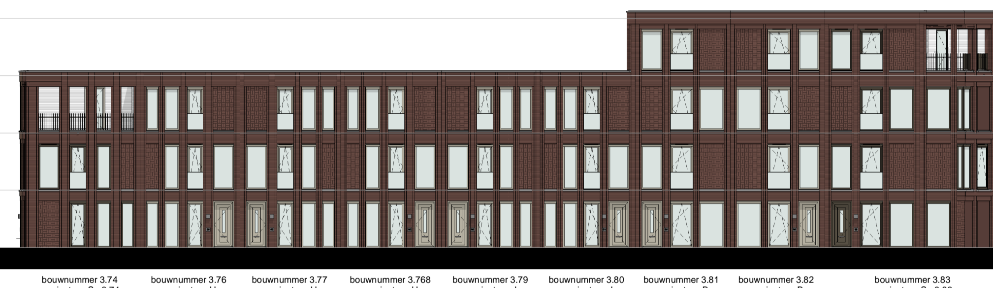
gevel 3.4 1 : 200

▽ +9240 03 derde verdieping ▽ +6160 02 tweede verdieping ▽ +3080 01 eerste verdieping ▽ Peil=0 00 begane grond