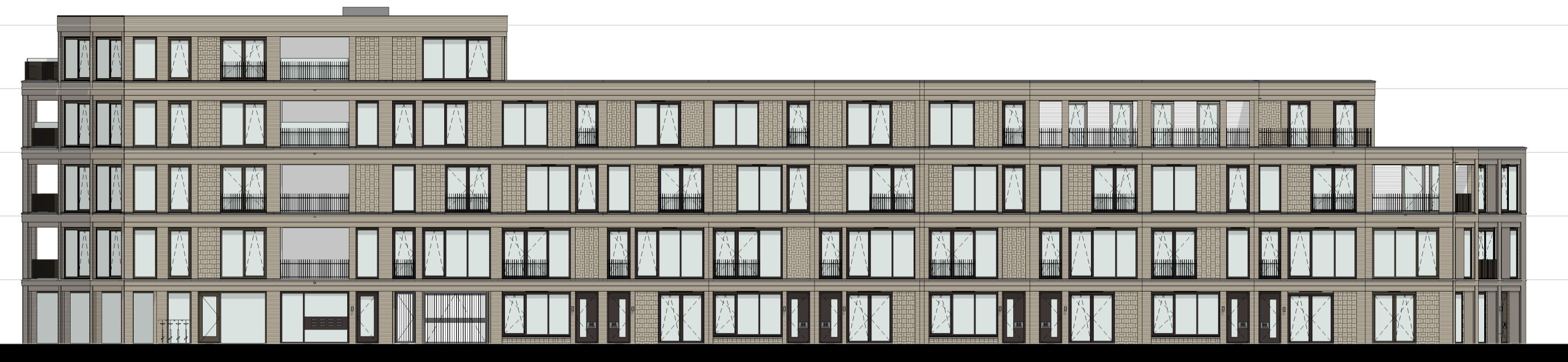
gevel 3.1 1 : 200

4e bouwnummer 3.96 3e bouwnummer 3.93 2e bouwnummer 3.90 1e bouwnummer 3.87 woningtype A.3.02 bg commercieel 4e bouwnummer 3.95 3e bouwnummer 3.92 2e bouwnummer 3.89 1e bouwnummer 3.85 woningtype A.3.01 bouwnummer 3.65 woningtype A bouwnummer 3.66 woningtype A bouwnummer 3.67 woningtype A bouwnummer 3.68 woningtype A bouwnummer 3.69 woningtype A bouwnummer 3.70 woningtype D bouwnummer 3.71 woningtype D bouwnummer 3.72 woningtype D bouwnummer 3.73 woningtype Sp.3.73