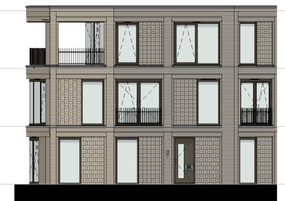
gevel 3.2 1 : 200

▽ +15400 05 vijfde verdieping ▽ +12320 04 vierde verdieping ▽ +9240 03 derde verdieping ▽ +6160 02 tweede verdieping ▽ +3080 01 eerste verdieping ▽ Peil=0 00 begane grond