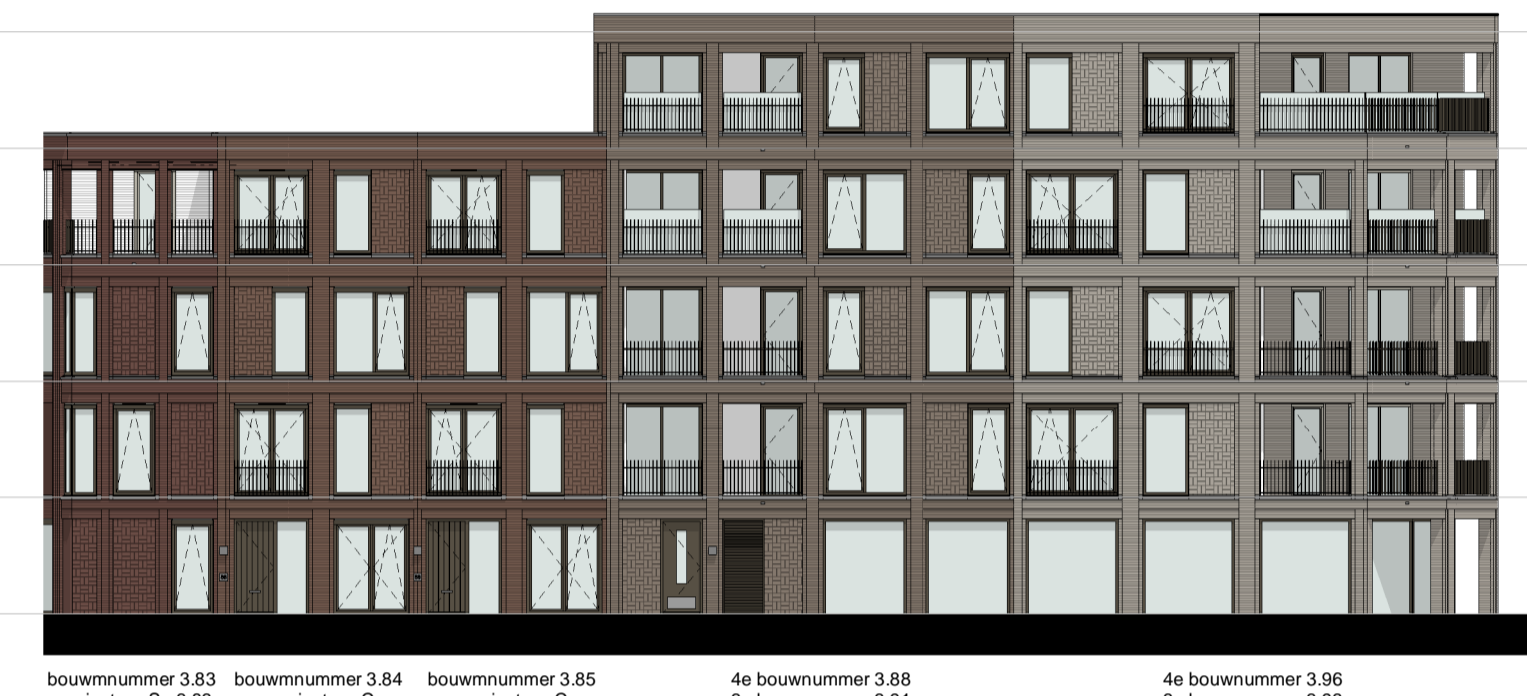
gevel 3.5 1 : 200

▽ +12320 04 vierde verdieping ▽ +9240 03 derde verdieping ▽ +6160 02 tweede verdieping ▽ +3080 01 eerste verdieping ▽ Peil=0 00 begane grond